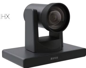
AMC-H1202 AMC-NH1202(NDI HX)