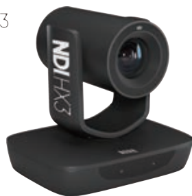
AMC-G330P/G320P AMC-NG330P/NG320P(NDI HX3)